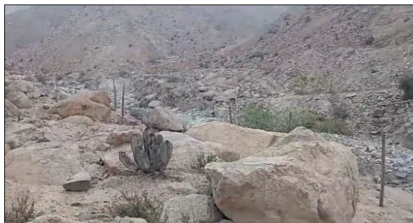
ZONA COLMATADA DE LA QUEBRADA MONTALVO